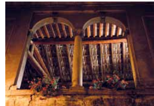
FINESTRE SULLA STORIA Una bifora del centro storico di Ala. Nella pagina a fianco: uno scorcio sulla Piazza San Giovanni con figuranti in costume settecentesco.

Vallagarina, a partire dal 1411, sotto il dominio di Venezia. Allora ad Ala cominciano a insediarsi le prime potenti famiglie forestiere, che detengono il potere economico della città, e che con le loro dimore signorili contribuiscono ad espanderne la struttura urbanistica. È proprio sullo scorcio del dominio dei Dogi che cominciano anche a diffondersi la coltivazione del gelso e l'allevamento dei bachi da seta. E sarà poi nel corso del '500 che, grazie anche a una situazione politica più stabile nell'orbita della Casa d'Austria, le attività manifatturiere e commerciali cominceranno a ingrandirsi. Ma andiamo con ordine.