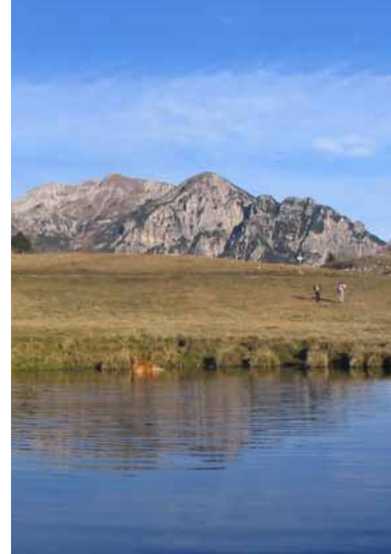
DOLOMITI IN MINIATURA Scorcio delle Piccole Dolomiti e del Gruppo del Carega visti dall'altipiano dei Lessini. Nella pagina a fianco: vacche al pascolo presso una pozza d'alpeggio dell'Alta Lessinia.

Parcheggiata la macchina nella piazza di Ronchi, allontanandosi dal piccolo borgo, ci si incam-