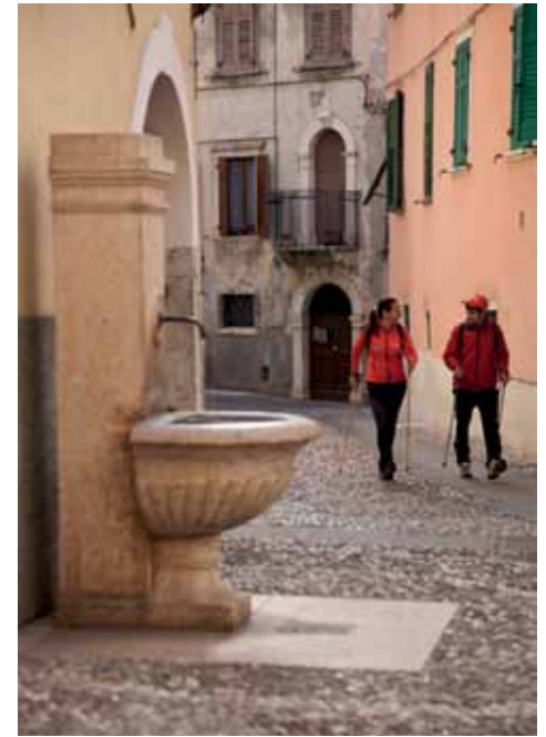
CAMMINATORI BOREALI Nordic walking ad Ala.

ha una facciata tarchiata e solida: l'aspetto severo del portale e delle finestre contornate da marmi squadrati, contrasta con la serenità del cortile interno e della leggiadra teoria di arcate decorate da mascheroni. Percorrendo l'ultimo tratto di via Nuova e la via Bresciani ci troviamo in piazza Giovanni XXIII , il cui aspetto risale alla seconda metà dell'800, quando la piazza divenne punto di collegamento tra il centro abitato e la ferrovia da poco costruita. Allora la piazza divenne un "passeggio pubblico": abbattuta la Porta Italia che la chiudeva verso sud, furono costruiti l' Ospedale Civico (1844) e la scuola elementare (primi '900) e si piantarono i grandi platani che ancora oggi la ombreggiano. Seguendo la via Gattoli ci addentriamo in uno dei quartieri cresciuti nel Seicento, quando la città s'ingrandì per la produzione e i commerci dei velluti di seta. Nell'antica piazzetta Burri ci accolgono una casa con altana, una fontana del '600 e la facciata settecentesca di palazzo de' Pizzini , ornata di finestre con cimasa barocca dove spicca l'affresco di scuola veronese che alcune fonti attribuiscono a Bernardino India. Il palazzo settecentesco era stato costruito per ospitare principi, nobili, signori in viaggio tra Italia e Germania. Possiamo ancora vedere, tra i medaglioni, gli stucchi e le tele della grande sala barocca, una dama che si affaccia dall'alto della balaustra, sullo sfondo degli affreschi allegorici