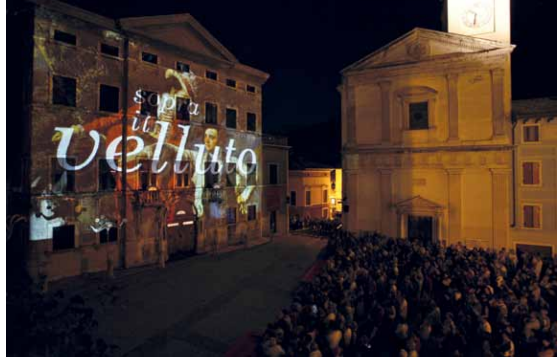
NOBILE ALA Sopra, in senso orario: Palazzo Angelini ; figuranti in costume settecentesco in occasione di Città di velluto ; esposizione permanente sul velluto a palazzo de' Pizzini . In basso: scorcio notturno di piazza del Mandolin . Nella pagina a fianco, in senso orario: proiezione di immagini per Città di velluto ; Temenuschka Vesselinova al Museo del pianoforte ; figuranti per Città di velluto ; cortile del ristorante La Luna Piena .