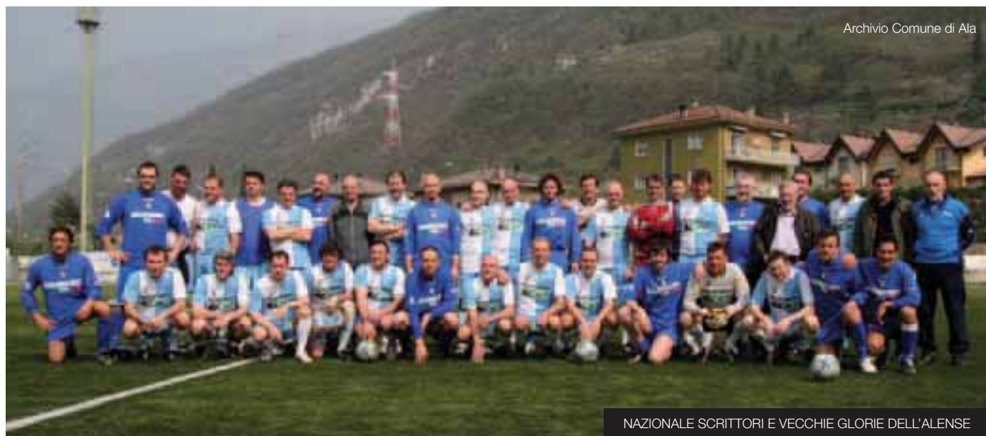
NAZIONALE SCRITTORI E VECCHIE GLORIE DELL'ALENSE

La Nazionale Scrittori ha incontrato le vecchie glorie dell'Unione Sportiva Alense