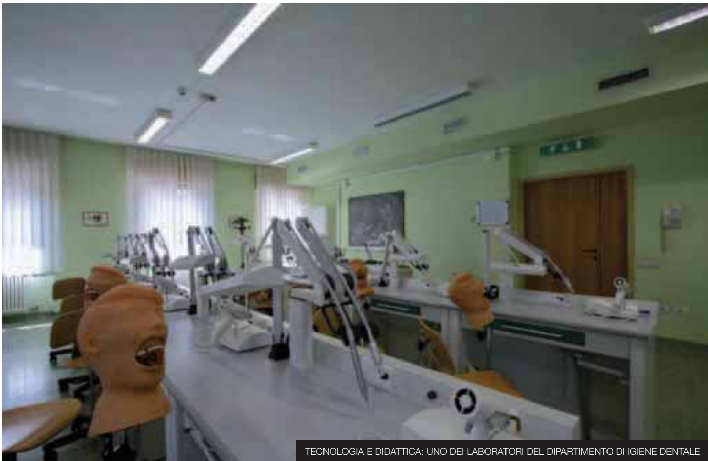
TECNOLOGIA E DIDATTICA: UNO DEI LABORATORI DEL DIPARTIMENTO DI IGIENE DENTALE

non rifarei. E, infatti, l'anno successivo ho cercato un alloggio a Rovereto”.