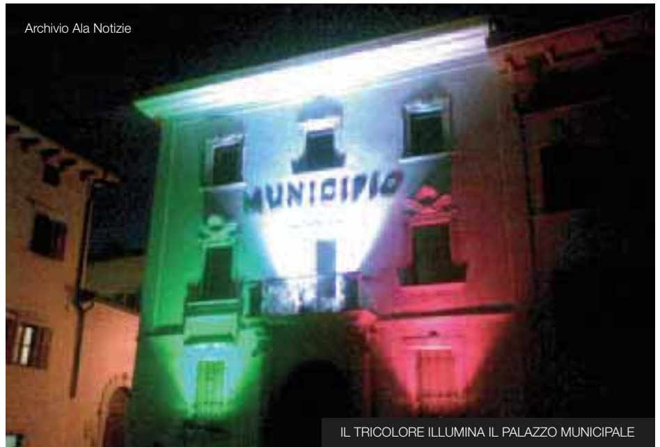
IL TRICOLORE ILLUMINA IL PALAZZO MUNICIPALE

della libera e pacifica convivenza. In un’Italia che, oggi come oggi, appare più che altro drammaticamente unita dalle piaghe della crisi e della disoccupazione, c’era il rischio che questa celebrazione si caricasse di troppa enfasi. E, invece, ha saputo offrire degli spunti di riflessione importanti. Al di là di strumentalizzazioni e polemiche questo anniversario è stato un’occasione impor-