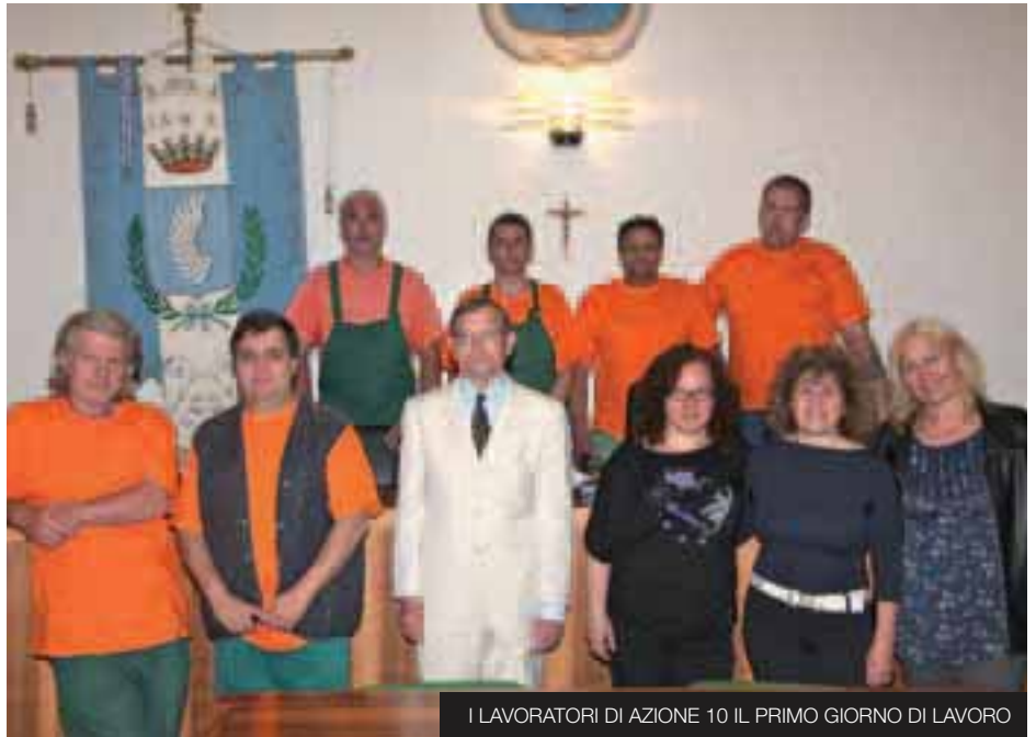
I LAVORATORI DI AZIONE 10 IL PRIMO GIORNO DI LAVORO

squadra di lavoratori sarà impiegata interamente all'interno degli uffici comunali. Saranno coinvolti l'ufficio di Segreteria, quello di Ragioneria, l'Anagrafe, l'ufficio Tecnico, l'ufficio Tributi e l'ufficio Turismo e Cultura. I nuovi addetti non copriranno posti previsti in pianta organica, ma aiuteranno di sicuro gli uffici a far funzionare meglio la macchina comunale. Per loro è stato individuato un mansionario articolato, in affiancamento al personale dell'ufficio, per il disbrigo delle pratiche arretrate. Nel dettaglio, i cinque nuovi assunti, saranno impiegati: 1) In attività di sistemazione e riordino dell'archivio dell'ufficio posto al piano terra del municipio; 2) Nel controllo e riordino degli atti deliberativi della giunta e del consiglio