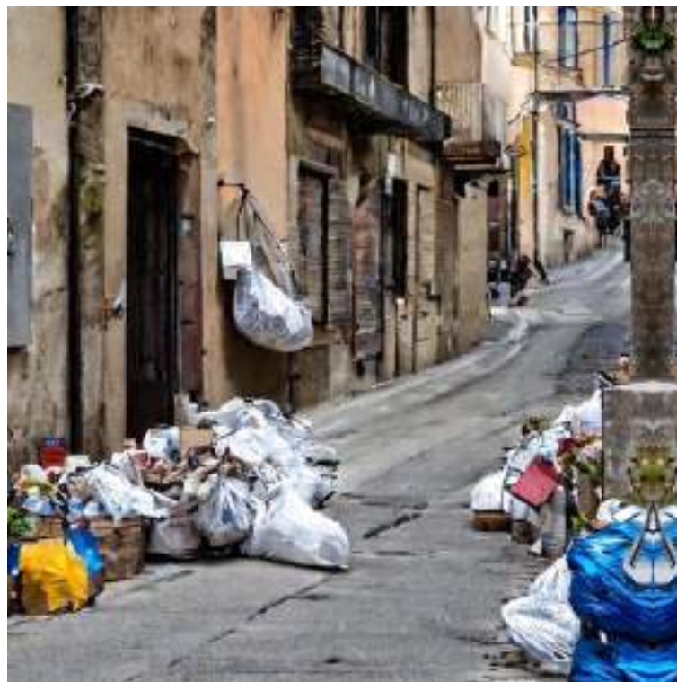
Fotografia generata dall'intelligenza artificiale di una via del centro storico ricoperta dai rifiuti: speriamo davvero che la situazione delle isole ecologiche non si ripeta nel porta a porta.

Con queste brevi righe non vogliamo necessariamente tacere il porta a