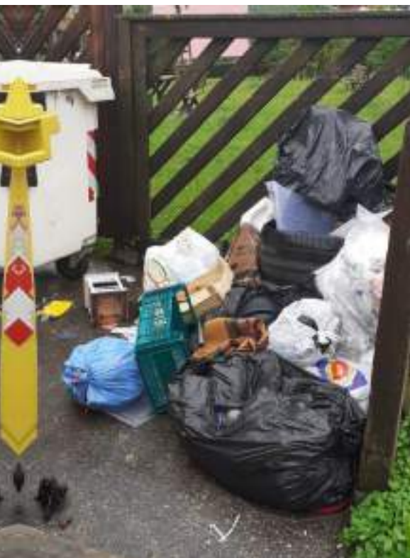
Le nostre isole ecologiche a volte si trasformano in vere e proprie discariche a cielo aperto.

La raccolta differenziata dei rifiuti è un tema di grande importanza per la tutela dell'ambiente e la sostenibilità del nostro territorio. Il Comune di Ala si trova di fronte a una scelta importante riguardo alla gestione dei rifiuti: passare dalla raccolta tramite isole ecologiche alla raccolta porta a porta per la plastica, la carta e il vetro.