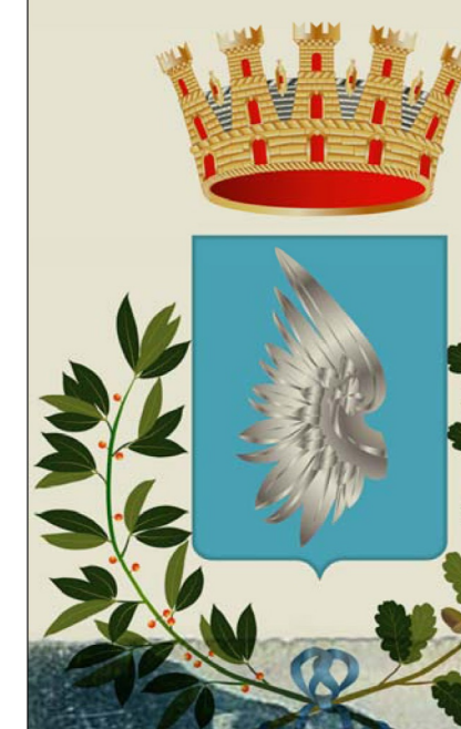
Tavola Numero 07.15

ai sensi della "Legge Provinciale 3 ottobre 2007, n.16 - Risparmio energetico e inquinamento luminoso" e s.m.i.